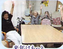
来年はもっと 弾けた～い！