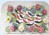
協力して出来上がった 作品。壁画にしました。