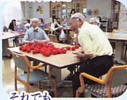
それでも 弾けんばかりの笑顔！

毎日毎日、うだるような暑さが続きましたネェ～！ 今年の夏祭り？盛大に行ないたいところではありましたが、このコロナの状況の中…。少し大人しめに？(笑) 開催致しました。