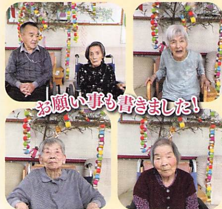
お願い事も書きました!