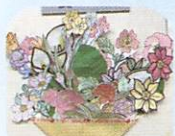
色塗した花で 花束制作！