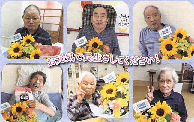
お元気で長生きしてください!