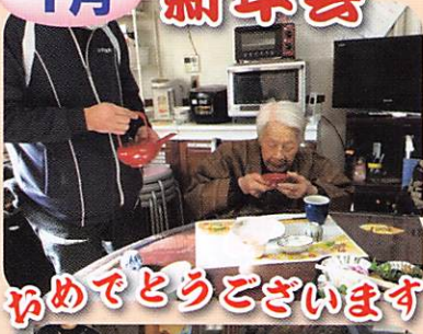
おめでとうございます。