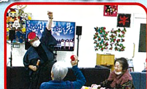
今年は桃太郎も助っ人に来てくれました!