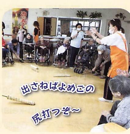
出さねばよめこの