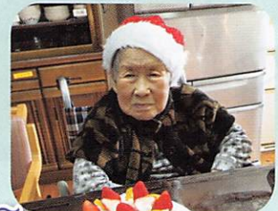
サンタさんからプレゼント! 幾つになっても嬉しいね~。