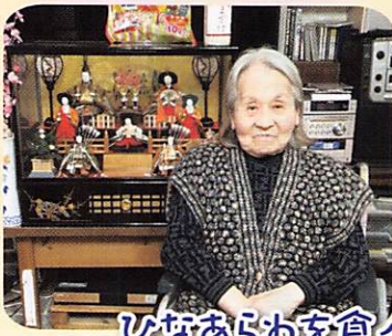
ひなあられを食べ、甘酒を飲みました!