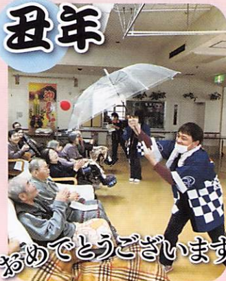
おめでとうございます。