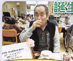
ステーキ・ビール