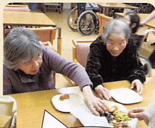
みんなで食べると うまかね〜!