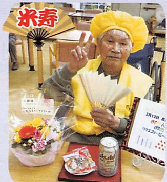
おめでとう ございます!