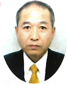
社会福祉法人 伊万里敬愛会