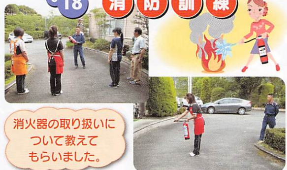
消火器の取り扱いについて教えてもらいました。