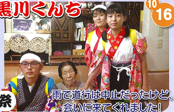
祭 雨で道行は中止だったけど、会いに来てくれました!