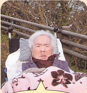
久しぶりに外に出て、嬉しかあ〜