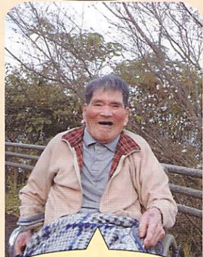
気持ちのよかなあ〜