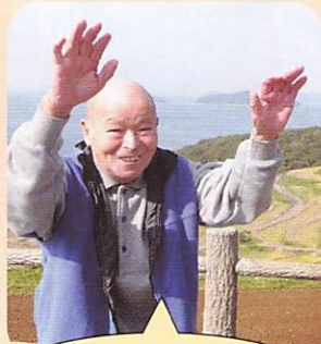
棚田の景色のよかあ〜