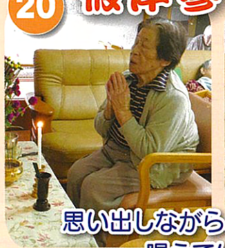
思い出しながら、真剣にお経を唱えています。