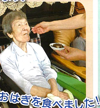
みんなでおはぎを食べました!