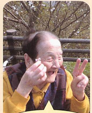
寒桜の前で...めずらしかあ〜