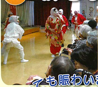
とても賑わいました!