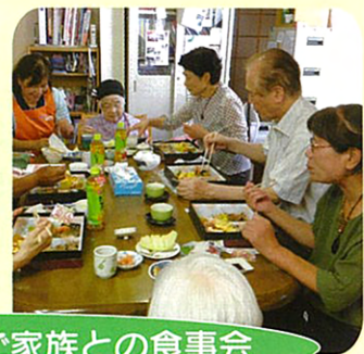
椎の木の家に帰り、ご家族との食事会