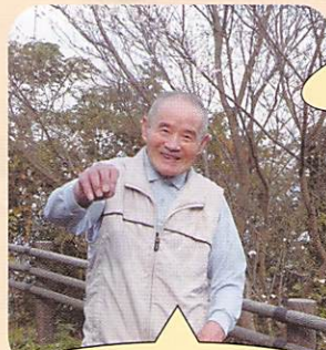
展望台はいつ来たやろかあ〜