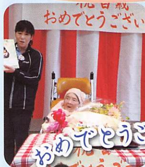
おめでとうございます。