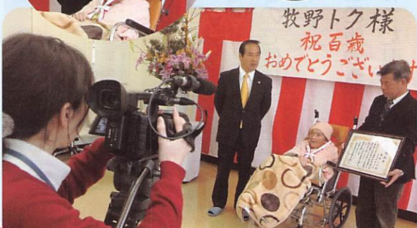
ケーブルTVで放送されました!