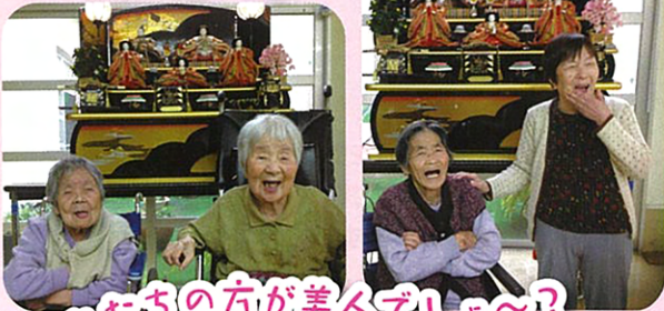
私たちが美人でしょ〜?