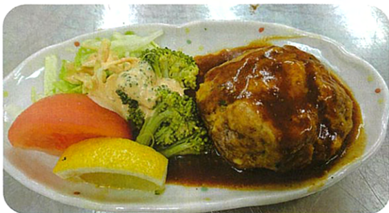
※たけのこは、みじん切りにします。