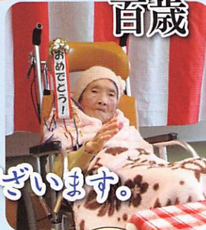
百寿メダルを頂きました。