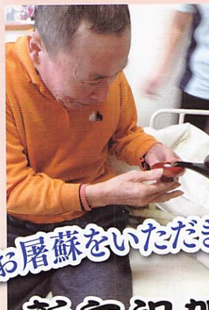
お屠蘇をいただきました。