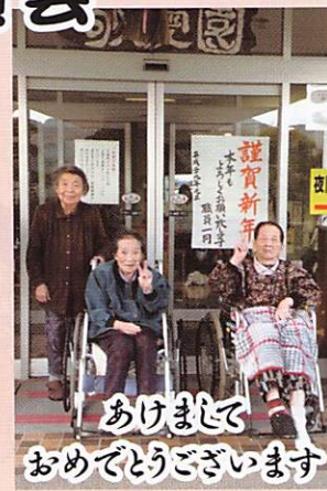
あけましておめでとうございます