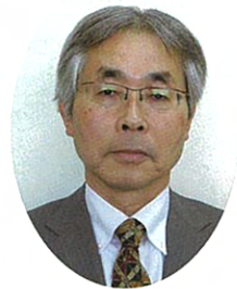
社会福祉法人 伊万里敬愛会