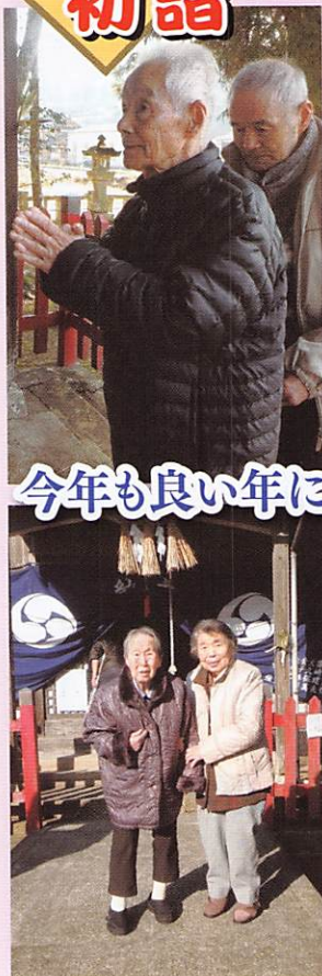
今年も良い年になりますように...