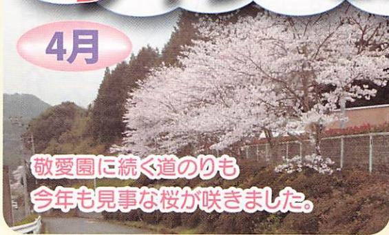
敬愛園に続く道のりも今年も見事な桜が咲きました。