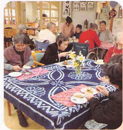
♥ボランティア喫茶(和み)