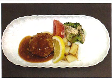
▲伊万里牛を使ったハンバーグです。

参加者からは、試食をしてみたいというお言葉や、食事が美味しい施設を選びたい等の声がたくさんありました。