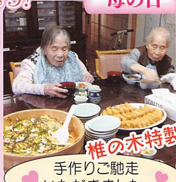
椎の木特製 手作りご馳走 いただきました。