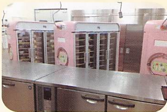
▲調理室 & 配膳室

これからはクックチルシステム（加熱した食品を急速冷却・冷凍保存）も導入していき、今まで以上に安心安全で、美味しい食事の提供に努めていきます。