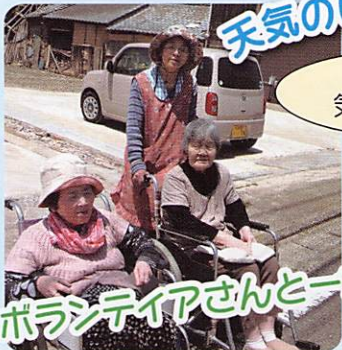
海風も 気持ち良か~!