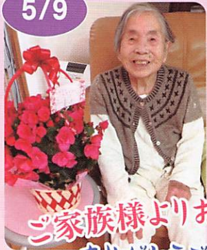
ご家族様よりお花の贈り物! ありがとうございました。