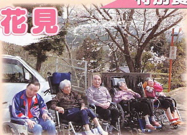
桜の下で皆さん楽しそうです!