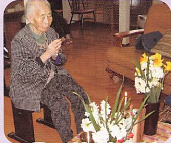
3/21 手を合わせると 心が落ち着きます。