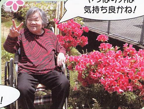
やっぱり外は 気持ち良かね!