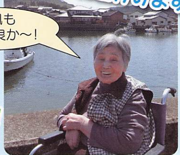
ボランティアさんと一緒に!