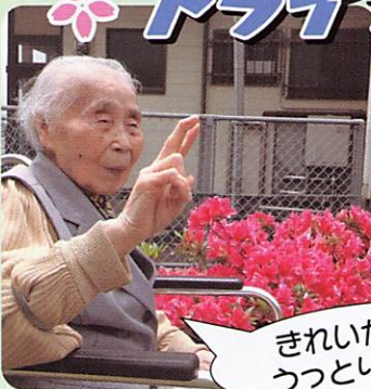
きれいか~! うつとり~!!