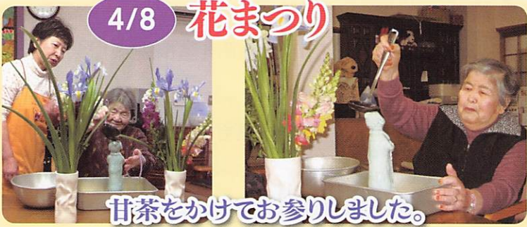
甘茶を掛けてお参りました。