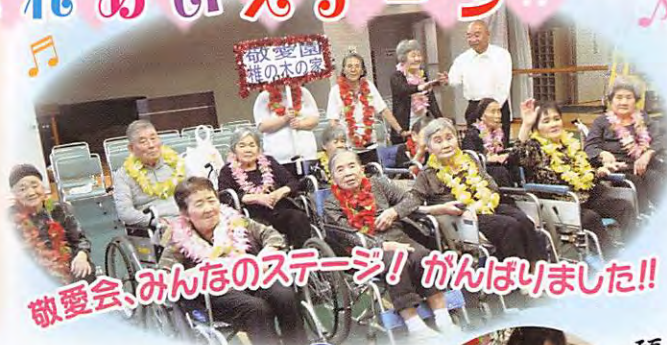
敬愛会、みんなのステージ! がんばりました!!