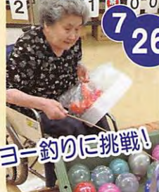
ヨーヨー釣りに挑戦!