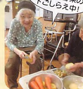
夏祭りで頂く カレーの野菜の 下ごしらえ中!