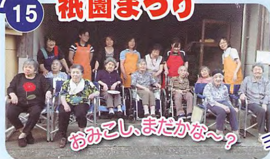
おみこし、まだかな~?