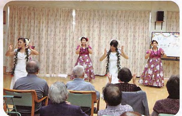
♥フラダンス愛好会 プルメリア様