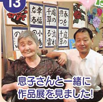
息子さんと一緒に 作品展を見ました!