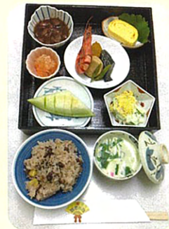
※クックチルを利用して作りました！