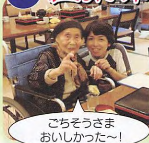
ごちそうさま おいしかった~!