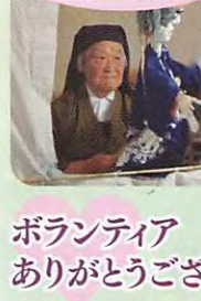
ボランティア ありがとうございます!