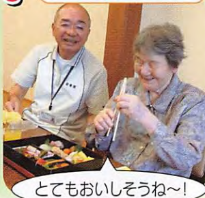
とてもおいしそうね~!