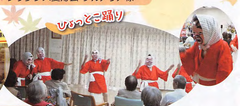
♥笑会(ほほえみの会)の皆様

雨が少なく、蒸し暑い夏でした。台風の影響も殆どなく良かったです。これからの季節は過ごしやすく、味覚の秋です。夏バテが少しでも回復できたらいいですね。