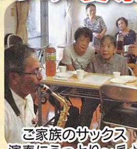
ご家族のサククス 演奏にうっとり~月!