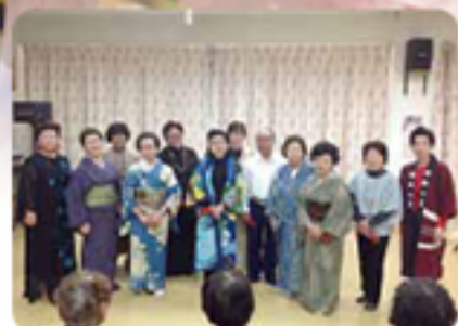
♥ 唐津ひまわり会様